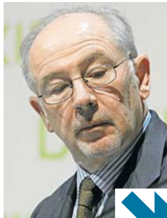
Malgrat tot, li donen premis.

Una de les narracions que més m'agrada de Massimo Bontempelli, el contista de Como, és aquella en què el protagonista queda atrapat a la porta giratòria de l'entrada d'un edifici i no en pot sortir. A Espanya, sembla que la porta giratòria sigui l'esport nacional d'un grapat de polítics selectes que han tingut molt poder i que, sense posar-se vermells, es recol·loquen en bancs o en grans corporacions per continuar cobrant i figurant. No hi fa res que mentre tenien responsabilitats de govern poguessin fer i desfer per afavorir aquella empresa determinada. No hi fa res, tampoc, que se serveixin d'un munt d'informació privilegiada que tenien gràcies al càrrec que ostentaven. Només faltaria que una mica d'ètica els esguerrés un bon contracte. Són homes que miren per ells, que saben treure un bon rendiment de la seva agenda de contactes i que tenen un refrany predilecte, l'" Ande yo caliente... "