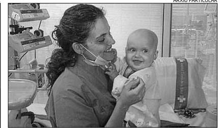
L'Abril somriu als braços de la mare, a l'hospital