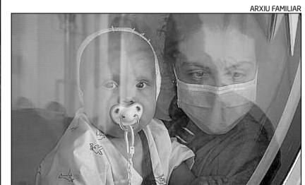
La mare i la filla en una cambra d'aïllament