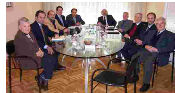
Comissió Científica Nacional de la Fundació

La Comissió Científica Nacional de la Fundació es reuneix cada any per avaluar les candidatures de projectes presentats per a la beca espanyola, per decidir quina mereix ser-ne la guanyadora i per tal de debatre sobre les línies d'actuació científica que ha de seguir l'entitat. La seva darrera reunió ordinària va tenir lloc el passat divendres 22 de novembre. Els metges hematòlegs i científics més reputats de tot l'Estat col·laboren de manera altruïsta amb la Fundació formant part d'aquesta comissió. ♦