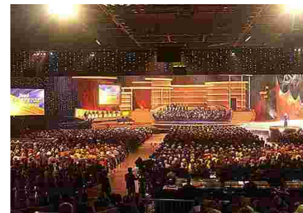
Panoràmica de la Gala Josep Carreras 2002

Gràcies a la solidaritat del públic alemany s'han endegat més d'un centenar de projectes de recerca i socials en benefici dels pacients de leucèmia. A l'Estat espanyol, amb fons recaptats a les Gales benèfiques d'Alemanya s'han finançat projectes al Banc de Sang de Cordó de Barcelona; al Laboratori d'Al·loreactivitat establert a l'Institut Català d'Oncologia; al Servei d'Hematologia de l'Hospital Materno-Infantil Vall d'Hebron de Barcelona; a la Facultat de Veterinària de Madrid, i a l'Hospital Clínic de Barcelona, entre d'altres centres assistencials. ♦