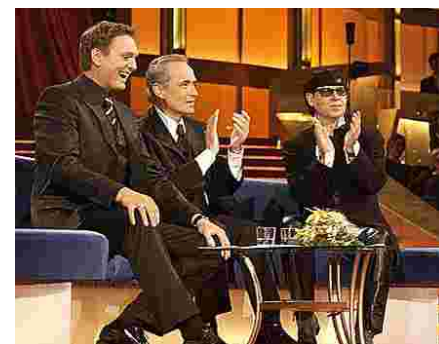
Axel Bulthaupt i Josep Carreras conversant amb Klaus Meine

"Qui té esperança és fort" va ser el lema de la Gala Josep Carreras 2002, l'èxit de la qual va superar tots els índexs de donacions obtinguts fins a la data. Axel Bulthaupt i Josep Carreras van ser els presentadors de la marató benèfica de més èxit a tot Alemanya que s'emet des de la nova Fira de la ciutat de Leipzig.