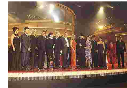
Els artistes que van donar suport a la Gala

La Gala combina reportatges de la malaltia, reportatges sobre el resultat de projectes finançats per la Fundació i testimonis de persones afectades amb actuacions artístiques de primer nivell. En aquesta ocasió, Josep Carreras tampoc no va estar sol a l'escenari, ja que la gala va comptar amb la presència d'artistes tan prestigiosos com Plácido Domingo, Harry Belafonte, Chris Rea, Peter Maffay, Klaus Meine, Sarah Connor i d'altres molts artistes que van participar de manera altruista.