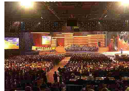
Panoràmica de la Gala Josep Carreras 2002

El passat dijous 19 de desembre va tenir lloc la vuitena Gala Josep Carreras consecutiva al primer canal de la Televisió alemanya ARD. El públic alemany va mostrar una resposta extraordinària a la crida a la solidaritat de Josep Carreras i va oferir donacions per un import de 6,65 milions d'euros.