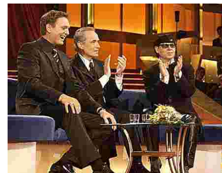
Axel Bulthaupt i Josep Carreras conversant amb Klaus Meine

Plácido Domingo va mostrar la seva solidaritat amb la lluita contra la leucèmia així com l'admiració per la tasca del seu company i amic Josep Carreras. Carreras i Domingo van cantar junts la nadala "El tamborilero" en castellà, moment que va suposar un dels punts més aclamats de la Gala.