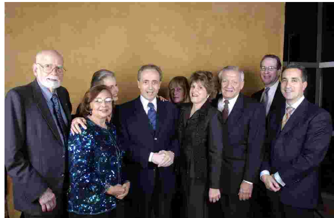
Junta del Patronat de la Fundació americana

Aprofitant l'estada del Sr. Carreras als Estats Units, la Fundació Josep Carreras nord-americana (US Friends of the José Carreras Leukaemia Foundation) va celebrar la reunió ordinària de la Junta del Patronat.