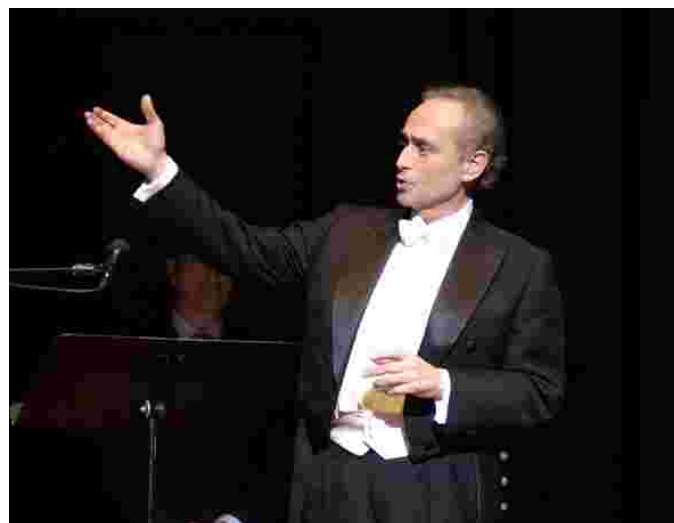
Josep Carreras al Benaroya Hall