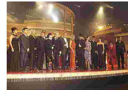
Els artistes que van donar suport a la Gala

"Qui té esperança és fort" va ser el lema de la Gala Josep Carreras 2002, l'èxit de la qual va superar tots els índexs de donacions obtinguts fins a la data. Axel Bulthaupt i Josep Carreras van ser els presentadors de la marató benèfica de més èxit a tot Alemanya que s'emet des de la nova Fira de la ciutat de Leipzig.