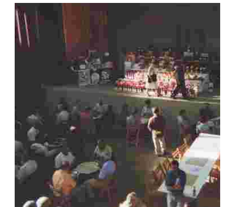
Campionat de Botifarra 2002

A la ciutat de Figueres va tenir lloc el passat 19 d'octubre i per tercer any consecutiu el campionat de Botifarra en benefici de la nostra entitat i de la lluita contra el càncer. Nombroses empreses i institucions locals i d'arreu de Catalunya van col·laborar en aquesta generosa iniciativa oferint regals de manera gratuïta, cedint espais o serveis. A tots ells i, sobretot, als impulsors del campionat, moltes gràcies. ♦