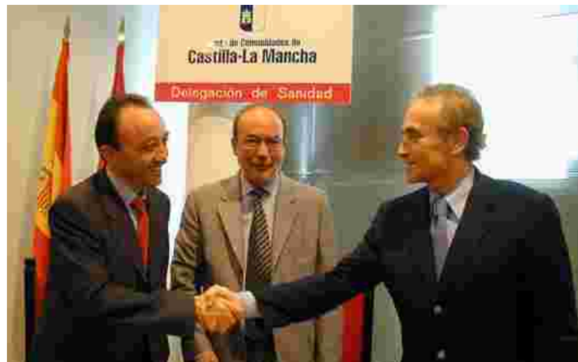
Signatura del conveni amb la Conselleria de Sanitat de Castella La Manxa. Albacete, 13 de setembre de 2002

L'objectiu fonamental dels convenis és la coordinació de recerques de medul·la òssia i sang de cordó umbilical per als pacients de la comunitat candidats a trasplantament de donant compatible no emparentat. També es fomentarà la donació voluntària de medul·la òssia i es tipificaran els corresponents donants als laboratoris d'histocompatibilitat de la Comunitat. Les Conselleries de Sanitat col·laboraran activament en aquesta gestió, en el finançament de les tipificacions, en l'extracció de medul·la òssia per al seu trasplantament i en l'estricta manteniment de l'anonimat dels donants. ♦