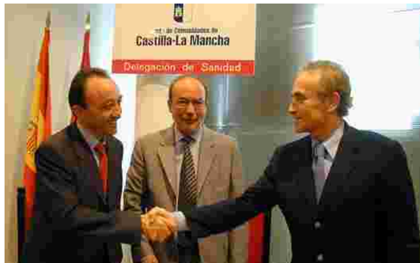
Signatura del conveni amb la Conselleria de Sanitat de Castella La Manxa. Albacete, 13 de setembre de 2002

L'objectiu fonamental dels convenis és la coordinació de recerques de medul·la òssia i sang de cordó umbilical per als pacients de la comunitat candidats a trasplantament de donant compatible no emparentat. També es fomentarà la donació voluntària de medul·la òssia i es tipificaran els corresponents donants als laboratoris d'histocompatibilitat de la Comunitat. Les Conselleries de Sanitat col·laboraran activament en aquesta gestió, en el finançament de les tipificacions, en l'extracció de medul·la òssia per al seu trasplantament i en l'estricta manteniment de l'anonimat dels donants. ♦