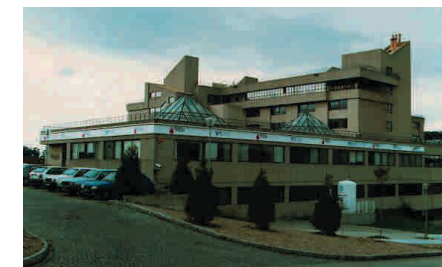
Edifici del Centre de Transfusió de Galícia, Santiago de Compostel·la

A més de la base de Donants de Medul·la Òssia, el Centre de Transfusió de Galícia gestiona un Banc de Sang de Cordó Umbilical. Aquesta font de cèl·lules mare de la sang pot substituir les donacions de