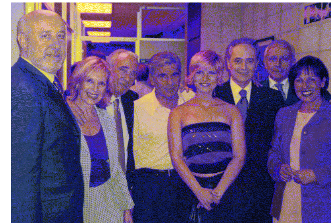
Pedro Ruiz i Pasi6n Vega amb Josep Carreras i patrons de la Fundació

El dijous 13 de juny "La Noche Abierta" (Televisió Espanyola - La 2) va oferir des de Sant Cugat un programa especial en benefici de la lluita contra la leucèmia amb l'objectiu d'aconseguir socis per a la Fundació Internacional Josep Carreras. El mateix Josep Carreras va explicar en directe les necessitats d'un ajut solidari per a aquests pacients.