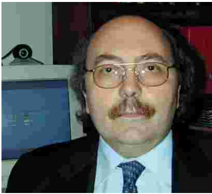
Dr. Enric Carreras

El ràpid i constant progrés de les noves tecnologies està modificant dia a dia els nostres hàbits de vida. Avui, a ningú li estranya rebre o fer una trucada telefònica des del cim d'una muntanya; comprar les entrades pel cinema en un caixer automàtic, o disposar d'hores i hores de música en un mínuscul reproductor de butxaca. En un dels aspectes en que més s'ha progressat és en el de les transmissions, i avui dia és possible enviar i rebre en pocs segons una gran quantitat d'informació d'un lloc a un altre del món i, a més, assegurar la confidencialitat de les dades. Aquest fet ha permès accedir amb facilitat a milers de pàgines d'informació de tot tipus penjades a Internet, consultar dades bancàries, i fer transaccions segures des d'un telèfon mòbil o des d'un ordinador des de l'altre punta del món i que persones degudament autoritzades puguin consultar amb tota confidencialitat bases de dades mèdiques a distància. Totes aquestes millores permeten una gestió de les dades molt més ràpida i acurada, fet que indefectiblement repercuteix en un millor servei pels usuaris d'aquests sistemes.