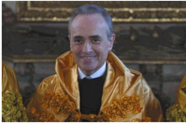
Josep Carreras recibe el Doctorado Honoris Causa de la Universidad de Coimbra