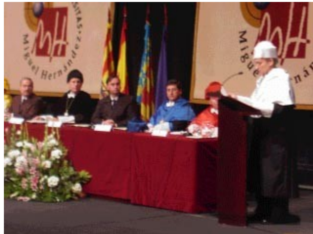
Josep Carreras recibe el Doctorado Honoris Causa de la Universidad Miguel Hernández

Varias Universidades y entidades han reconocido la labor llevada a cabo por la Fundación Josep Carreras con su presidente al frente. El Palau Altea Centre d'Arts acogió el pasado 9 de enero de 2003, el solemne acto de investidura como Doctor Honoris Causa por la Universidad Miguel Hernández al Sr. Josep Carreras. La Universidad ha decidido otorgar esta distinción a Josep Carreras por su extraordinaria carrera artística y su perfil humano como Presidente de la Fundación.