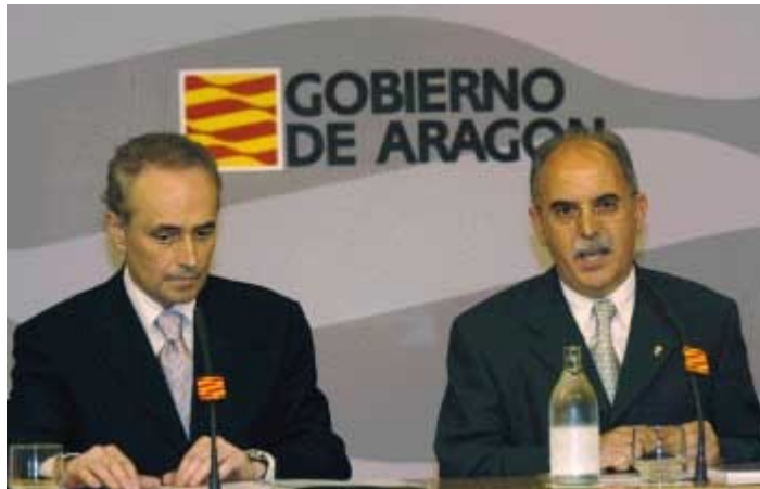
Presentación del convenio con la Consejería de Sanidad de Aragón

Durante el año 2003, se han firmado convenios de colaboración con las Consejerías de Sanidad de los gobiernos de Cantabria, Aragón y Baleares, siguiendo a los convenios firmados el pasado año 2002 con Madrid; Castilla La Mancha, Aragón, Baleares y Extremadura después del traspaso de competencias sanitarias por parte del Insalud a varias comunidades autónomas.