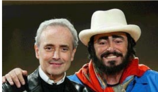
Josep Carreras y Luciano Pavarotti durante el ensayo de la Gala el pasado 18 de diciembre

Más tarde, el primer canal de la televisión pública alemana ARD ofreció la oportunidad a la Fundación de celebrar una maratón anual en beneficio de la lucha contra la leucemia. Desde diciembre de 1995 y hasta hoy se han celebrado ya 9 ediciones de esta importante Gala con unos extraordinarios resultados económicos, de proyección y de sensibilización social. La última gala tuvo lugar el 18 de diciembre de 2003 a las 20.15 horas con un resultado en donativos que superó todas las expectativas.