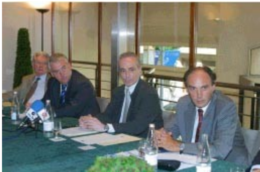
Josep Carreras y Josep Poblet firman el convenio de colaboración

El convenio manifiesta la voluntad de la Fundación Auditorio Josep Carreras - creada el diciembre pasado por la gestión del Auditorio Josep Carreras de Vila-seca - de celebrar un concierto anual extraordinario par recaudar fondos para la lucha contra la leucemia.