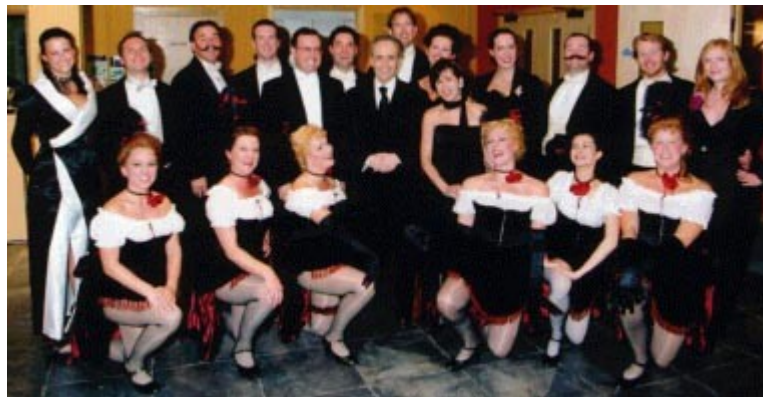
Josep Carreras con Diva Opera