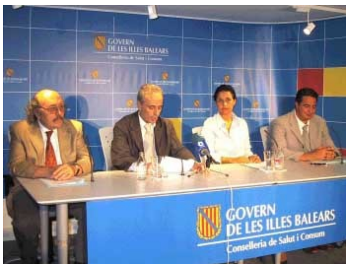
Presentación del convenio amb la Consejería de Sanidad de las Islas Baleares