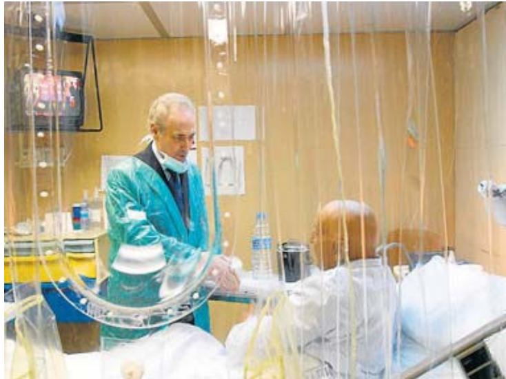
El tenor Josep Carreras explica que va crear la fundació fa 25 anys –després de salvar-se d'una leucèmia– per poder "tornar a la ciència el que m'ha donat".

En pro d'aquestes dues intencions de Carreras, hi pot fer molt La fleur –disponible des d'ahir a la web noleucemia.org –, ja que, com detallava Bosch, és una "pel·lícula sobre Josep Carreras, sobre la feina que fa la seva fundació i sobre la vida en si mateixa". El periodista avançava que els 75 minuts que dura el metratge serveixen per ensenyar el procés que s'utilitza per poder transportar les donacions de medul·la d'una banda del món a l'altra en només setenta-dues hores. Un períple que es pot observar al film de la mà de la persona que es dedica a fer aquest viatge, fruit dels bons resultats que s'obtenen de crear donants d'arreu del món en el Registre de Donants de Medul·la Òssia (REDMO) que va crear la fundació i que permet als malalts de leucèmia de l'Estat accedir a una llista de 21